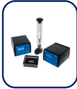
Live cell Incubator