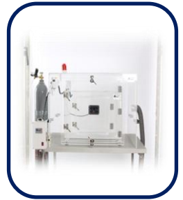
Controlled CO System