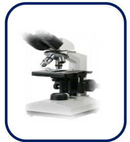
현 미 경