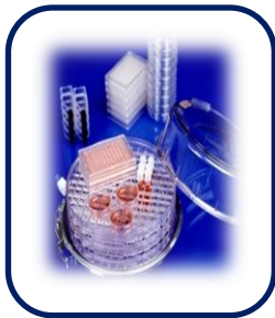
소형 하이폭시아 웹캠