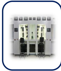
이동식 CGMP 작업테이블

RCCS-D : 790만원 RCCS-2D : 890만원 RCCS-4D : 1,600만원