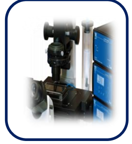
세포 산소 측정기 OPAL System