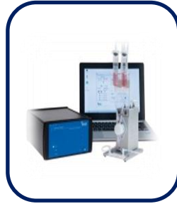
가상 혈관 세포배양 시스템 Pump System