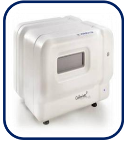
자동 이미지 분석장비