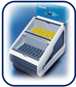
미생물 신속 검출 장비