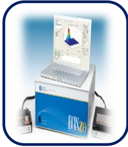
실시간 세포분석 시스템