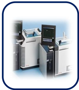
자동 세포동결 시스템