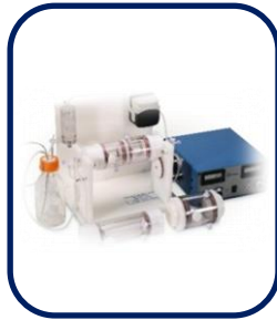
3D 세포 배양 시스템

FX-5000T : 6,270만원 FX-5000C : 6,270만원 STR-4000 : 2,670만원